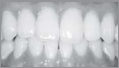
23歳10ヶ月(※トリメンション3年)