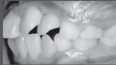
治療開始時(9歳3ヶ月)